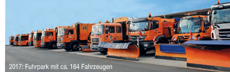
2017: Fuhrpark mit ca. 164 Fahrzeugen