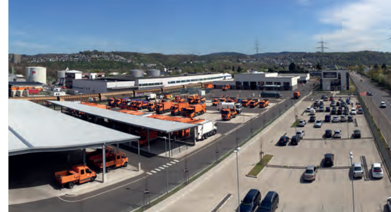
Zentraler Betriebshof: Blick über das Gelände