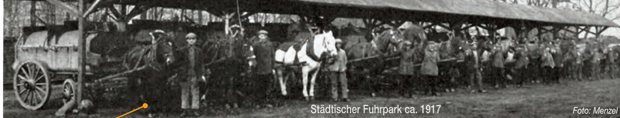
Städtischer Fuhrpark ca. 1917