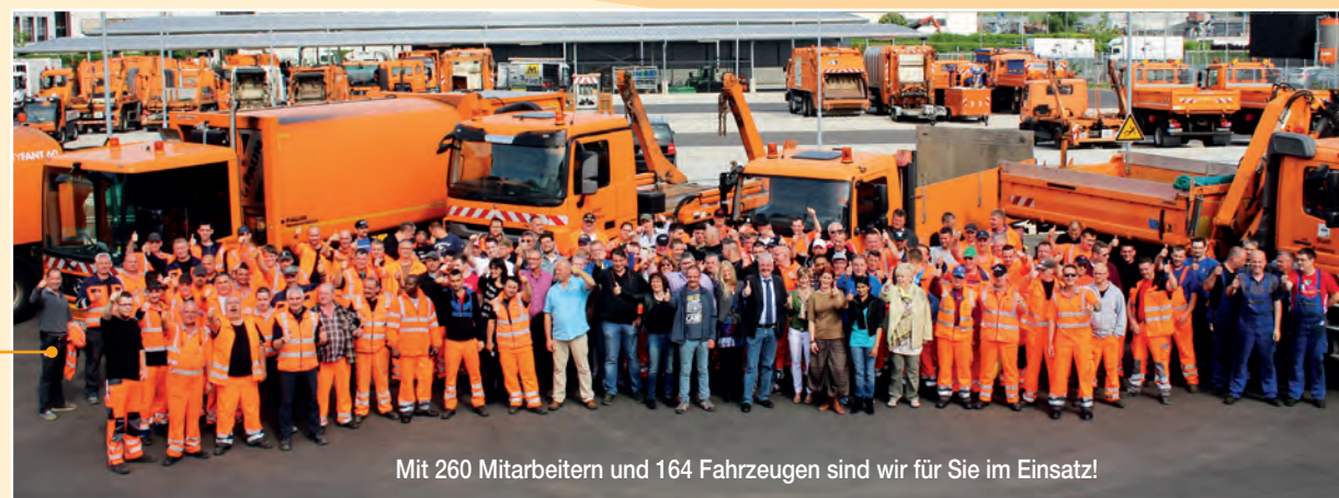
Mit 260 Mitarbeitern und 164 Fahrzeugen sind wir für Sie im Einsatz!